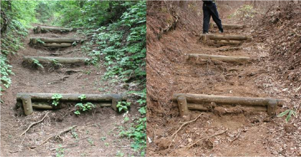
(1)-3 高篠峠から大野峠への登り（土壌変化）