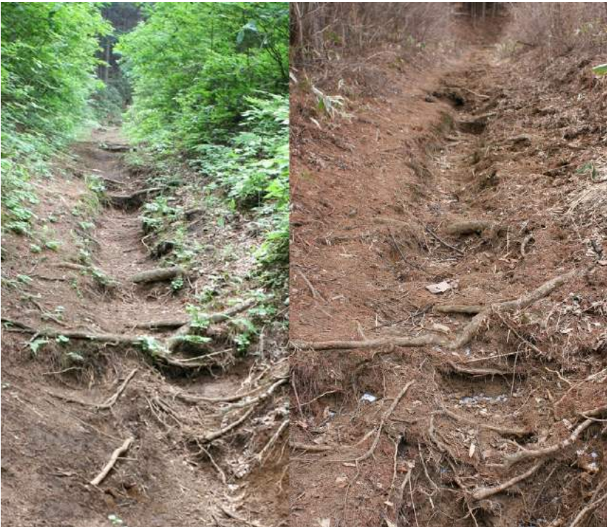
(1)-4 高篠峠から大野峠への登り（木段 3）